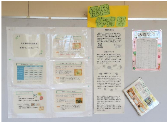
第一多目的室前の掲示板

内容は、献立表、給食の栄養価について、本校の食形態についてなどです。分かりやすくなるように写真も掲示してあります。ご来校の際にぜひ一度ご覧ください。